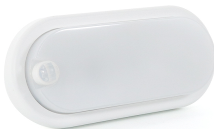
Tabella di riferimento