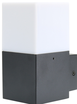
Tabella di riferimento